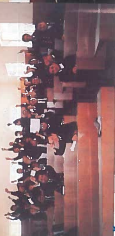
Sınav öncesi yapılan titiz grup çalışması (12:55)