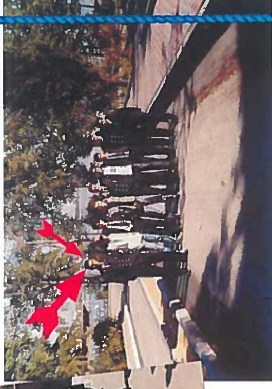
Resimdeki çıkıntıyı bulunuz! (tan tuat lan tuat!..)

Yüjit olmi şapkamı ver lan! Çizdirme karızmayı!