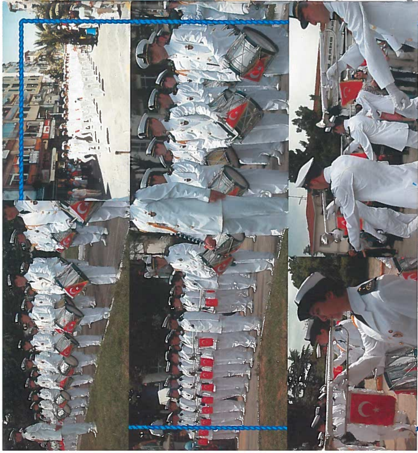
'98 - 2000 BORU-TRAMPET TAKIMLARI

Trampet Takımı! DİKKAAAAAYYTTT! Hazırlanım! uçuşa geçiyoruz..