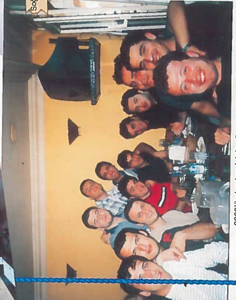
2003'ün buzbardak keyfi

Maden işçisi değil, denizci, Zonguldak değil, YDO!