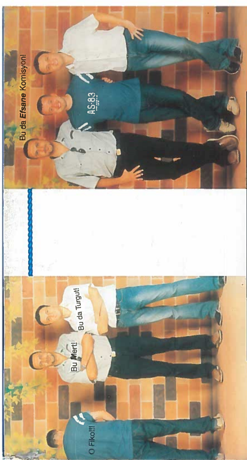
Bu da Efsane Komisyonu!